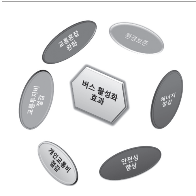
〈그림 1〉 버스 활성화 방안 효과

대중교통은 한 개인의 소유물이 아니라 공공의 이익이 우선되어야 하므로 환승 제